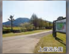
新潟ゴルフ倶楽部